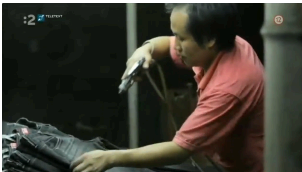
Cena Riflí / Dokument Nemecko 2012